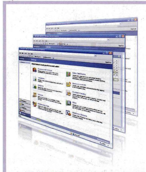
Die von EveryWare gehostete «Microsoft Dynamics CRM»-Lösung als Software as a Service.

Als wichtigste Weiterentwicklungen nennt Microsoft die Integration von «Windows Workflow Foundation», der Im- und Export als auch die Migration von Daten aus und in Dynamics CRM 4.0, die identische Benutzerumgebungen im Online- und Offlinebetrieb sowie eine verbesserte Benutzeroberfläche. Online-Statusinformation und -kommunikation finden in Echtzeit statt und sind eingebettet in ein rollenbasiertes Zugriffssystem auf sensible Kundendaten. Zudem lassen sich mit dem Report-Assistenten benutzergerechte Berichte erstellen. Microsoft Dynamics CRM 4.0 ermöglicht ausserdem die Installation von mehreren Instanzen auf derselben physischen Hardware. Die Lizenzierungsoptionen sind flexibel: Neu sind eine Workgroup Edition für maximal fünf Benutzer sowie «limitierte Userlizenzen» zu reduzier-